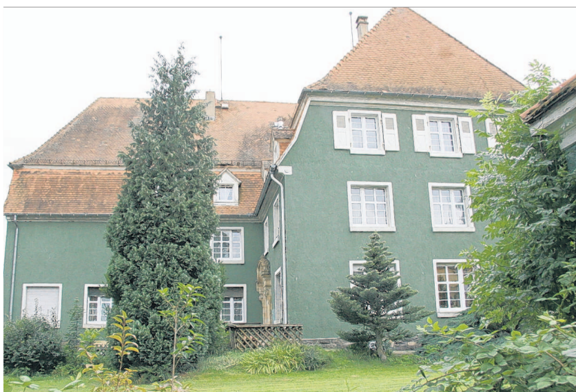
Kurz vor der Machtübernahme der Nationalsozialisten wechselte der Justizinspektor an das Laubacher Amtsgericht, wo er aber schon bald in die Kritik seiner Vorgesetzten geriet.